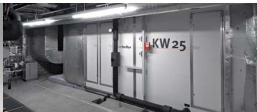
Optimal zur Kühlung von Bürogebäuden sowie Rechenzentren geeignet