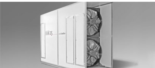
25 Einheiten Kälte aus einer Einheit Strom