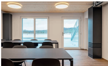
Rio-Therm V – Vertikalgerät