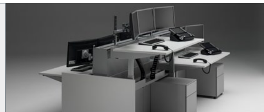
U-Com Sitz-Steh-Tisch mit Cool-Top